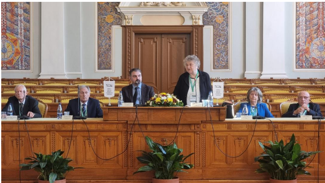
(A XXX. Nemzetközi Vegyészkonferencia megnyitója)

Az utóbbi években sikerült a Vegyészkonferencia számára egy sajátos szervezési rendszert kialakítani. Bár napjainkban, a tudományos élet tendenciája a szűk szakterületen történő konferenciaszervezés, Erdélyben, a kisebbségi lét nem teszi lehetővé a szakkonferenciák szervezését magyar nyelven. Így természetes egy általános, különböző szakterületeket felölelő vegyészkonferencia szervezés, mely lehetővé teszi a kutatók, egyetemi oktatók, ipari szakemberek jelenlétét, bármely szakterületről, ide kapcsolódva a környezettudomány, élelmiszerkémia, műanyag és gyógyszerkémia is.