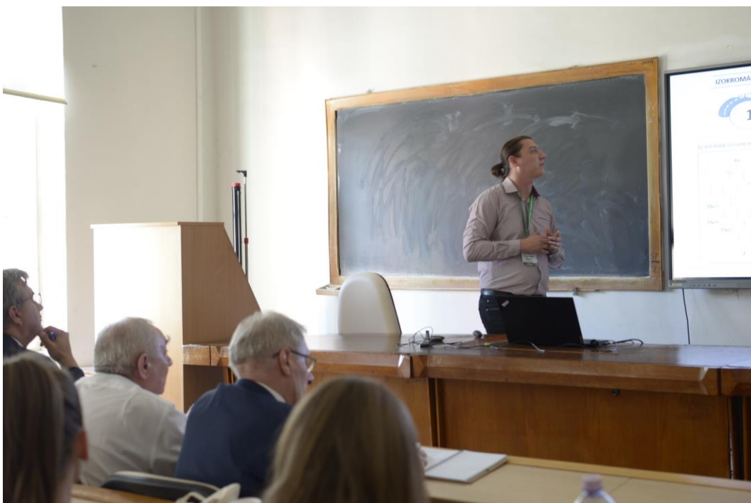
(Doktorandusz plénum előadás a XXX. Nemzetközi Vegyészkonferencián)

Ezt követi a Doktorandusz plénum szekció , mely lehetőséget biztosít a doktorandusz hallgatók számára egy 10-15 perces szóbeli prezentáció megtartására, verseny formájában. A program nagyon népszerű, ebben az évben 41 doktorandusz előadást mutattak be a Doktorandusz plénumon.